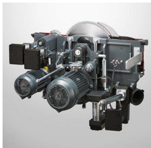
5.5 kw drie toerentallen manueel verstelbaar