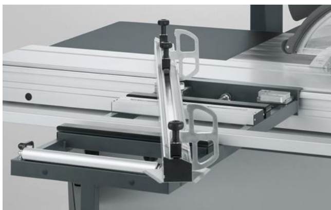
Winkel/verstekaanslag (WGA) met lengtecorrectie