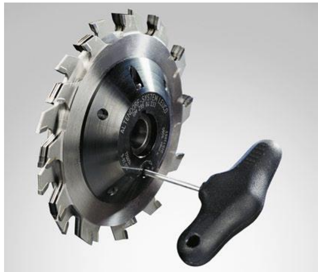
Rapido zaag enkel doormeter 120mm

Voor verdere vragen kan U ons steeds contacteren via email info@trimac.be of telefonisch op het nummer +32 471 63 55 74