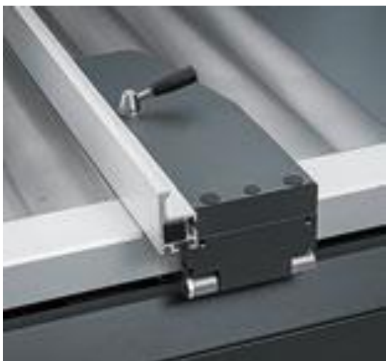
Zaagbreedte 1300 mm CNC sturing